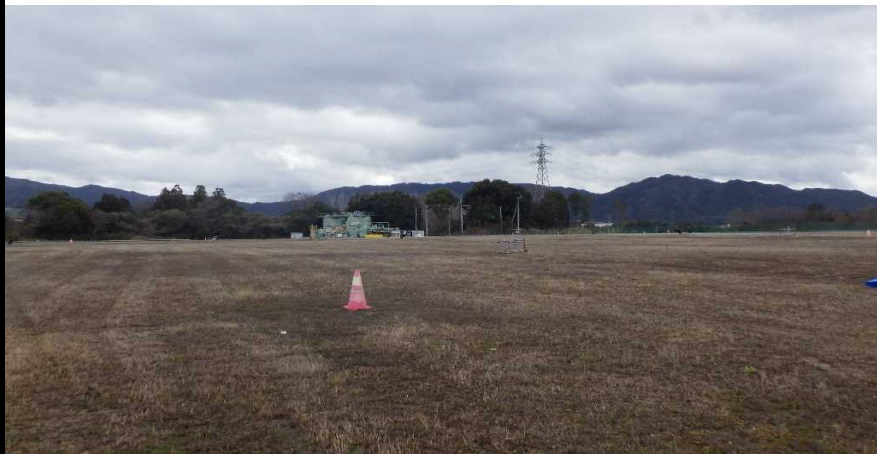
写真① 天端部の様子