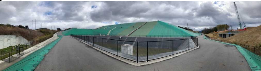
写真② 調整池付近の様子