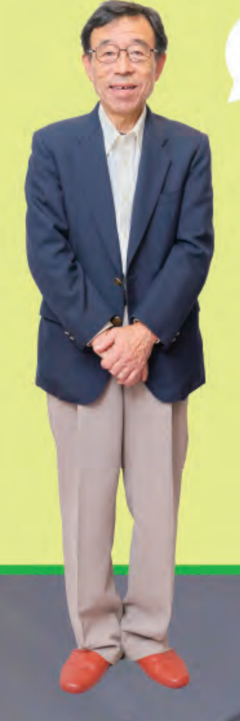
天体観測に詳しい館長さん

滋賀県で一番大きい、60cmもの反射望遠鏡があるよ! 昼間の 太陽の黒点や、夜の星空を観察してみよう。「TAGA」や「アケボノ ゾウ」など、ここで発見され、名前の付けられた小惑星もあるんだって。