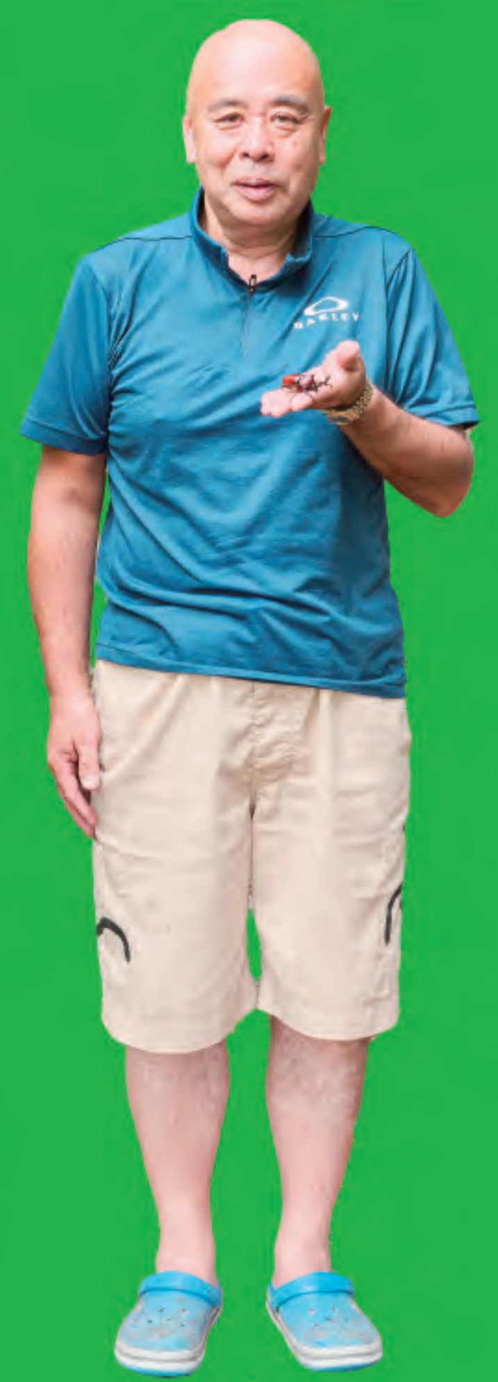
かぶとむしに詳しい スタッフさん