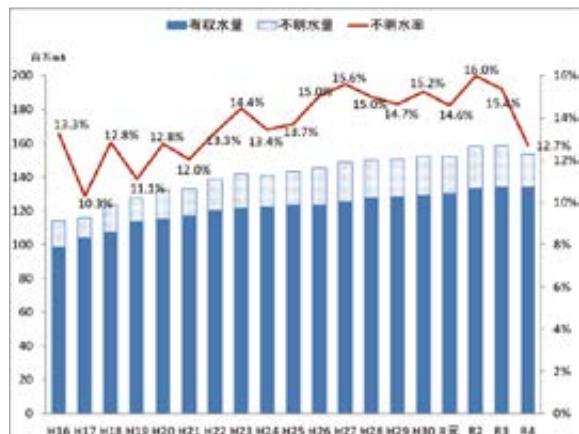
図1 琵琶湖流域下水道の不明水量の推移

不明水とは、処理場に流れてくる下水量のうち、下水道料金等で把握することが困難なものです。不明水は、主に雨天時浸入水と地下水等からなり、この内、雨天時浸入水については、雨どいから汚水ますへの誤接続や、汚水管の接続部の隙間等から流入するものです。下水道施設の老朽化等により不明水量は増加の傾向にあります。本県の年間の不明水率は、現状15%程度(図1)ですが、豪雨時に下水量が急激に増大することにより、マンホールからの溢水や下水道施設の冠水等を引き起こし、公衆衛生の悪化や下水道の施設被害が発生するという問題が起っています。