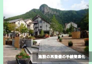
自然と調和した滞在環境の整備