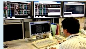
当庁施設を一括集中管理

デマンド監視装置にて使用電力量の見える化を行い、電力の使用を常時管理しています。