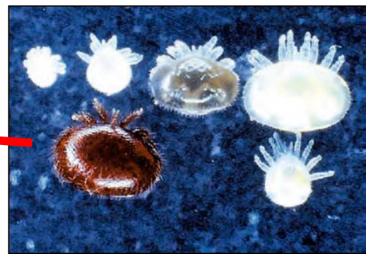
ミツバチヘギイタダニ