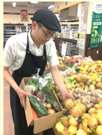
野菜レスキューBOX 詰合せ中