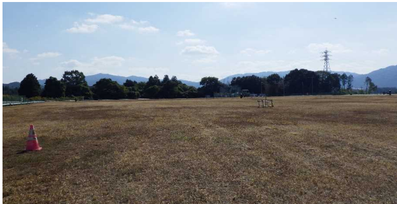
写真① 天端部の様子