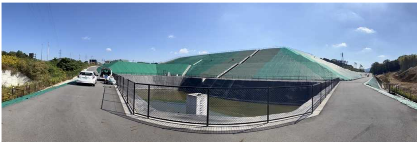
写真② 調整池付近の様子