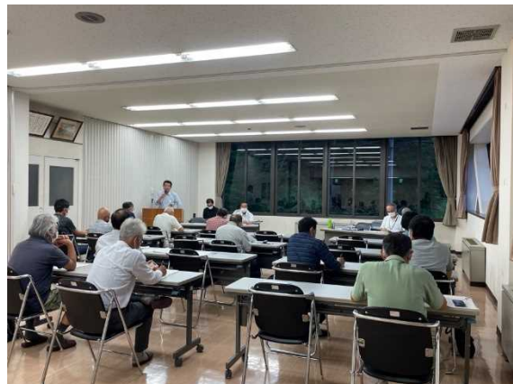
説明に耳を傾ける集落の代表者

当課では、認定農業者等との意見交換会や重点集落の話し合いへの参加など、関係機関と連携し、今後も地域計画策定に向けた支援を行っていきます。