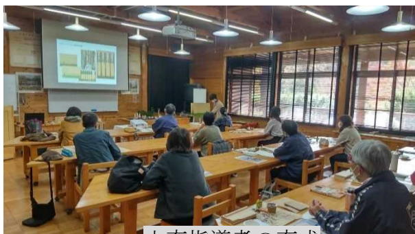
木育指導者の育成