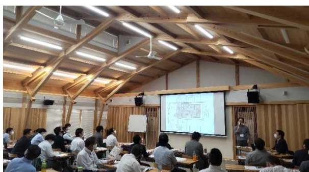
木造建築セミナー(滋賀県林業会館)