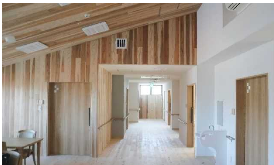
特別養護老人ホーム