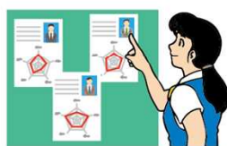
運転者の適性等の把握