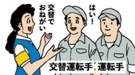
交替運転者の配置