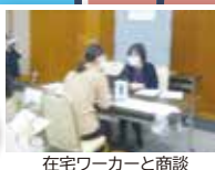
在宅ワーカーと商談