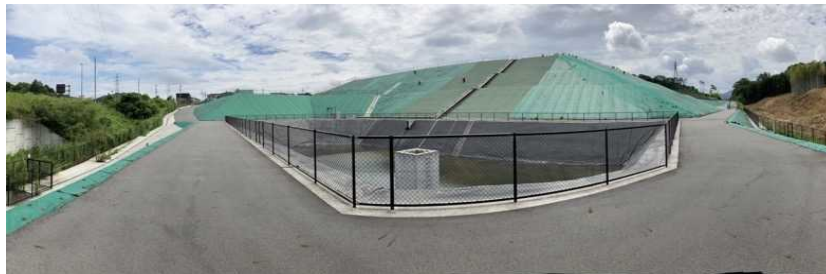
写真② 調整池付近の様子