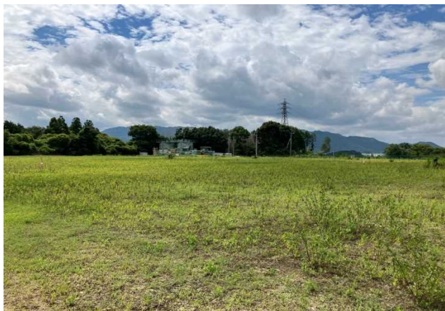
写真① 天端部の様子