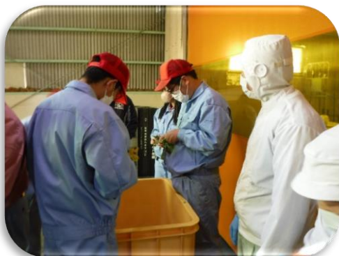
専門教科「農業」 (地元企業との連携授業)

1クラス8人程度の少人数で、基礎学力の充実を図り、社会的・職業的自立ができるように、一人ひとりの障害の状況や特性を把握し教育活動を展開する。