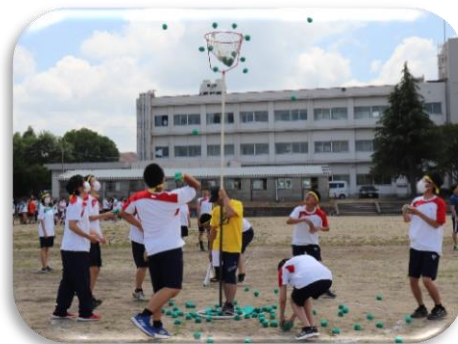
体育祭 (愛知高校との合同行事)

部活動についても、学習と共に重要視しており、全員参加を推進しています。本校と愛知高校の生徒が同じ部活動に参加し、両校の教員が互いの生徒を指導するなど、併設校としての利点を生かし、交流を図りながら活動しています。