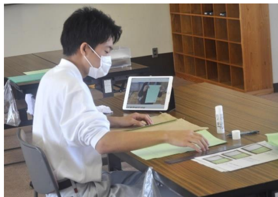
「校内作業実習（紙袋の製作）」