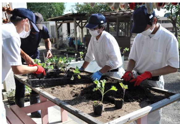
「農業（苗の鉢上げ作業）」

通学方法は、全員自主通学で、JR草津線を利用するか、もしくはバスや自転車を利用して登校しています。