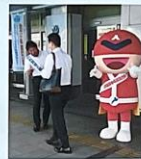
石山駅での街頭啓発の様子 2023.9.1

県内でも新規高校卒業者の就職試験において、本人に責任のない事項や身元調査につながる「家族構成」「家族の職業」「住所」「本籍地・出生地」などを質問する事例がなかなか無くならない現状があります。