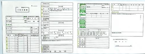
参考: 高校同和教育の実践 一広がりと深まりを求めてー(昭和58年9月 滋賀県教育委員会 他 発行)

昭和46年(1971) 近畿高等学校統一用紙制定 昭和48年(1973) 全国高等学校統一用紙制定