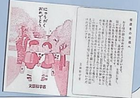
参考: 小学校入学時の教科書配布で使用される封筒

子どもたちは、発達段階や実態に合わせて、同和問題(部落差別)を歴史としての学習だけでなく、教科書無償化運動や統一応募用紙が制定された経緯や精神、公正な採用選考など差別をなくすための取組や成果についても学んでいます。