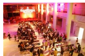
前回のハロウィン・ロビーコンサートの様子