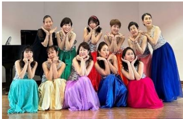
セシリアシンガーズ

出演：セシリアシンガーズ（歌） 乳幼児から入場OKの本格コンサート。歌を中心とした音楽劇をお楽しみください。