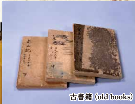
古書籍 (old books)