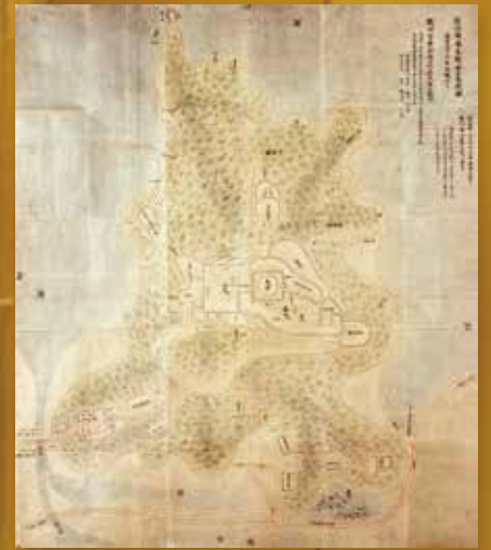
古絵図 (old illustration)