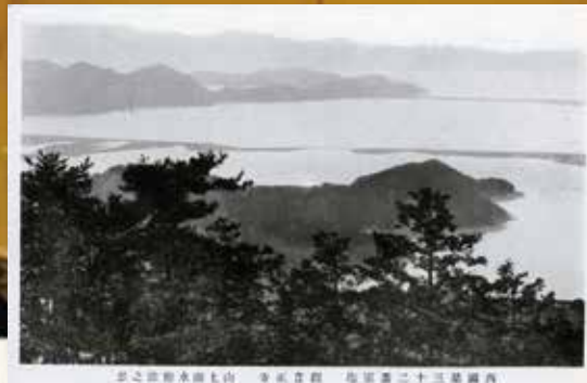
古写真 (old photo)