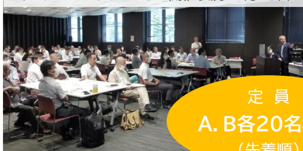
ネットゼロフォーラムしが開催状況 7月18日