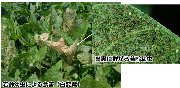
写真 若齢幼虫によるダイズの食害

お問い合わせ先：滋賀県病害虫防除所 TEL:0748-46-4926 FAX:0748-46-5559 Email:gc70@pref.shiga.lg.jp http://www.pref.shiga.lg.jp/boujyo/