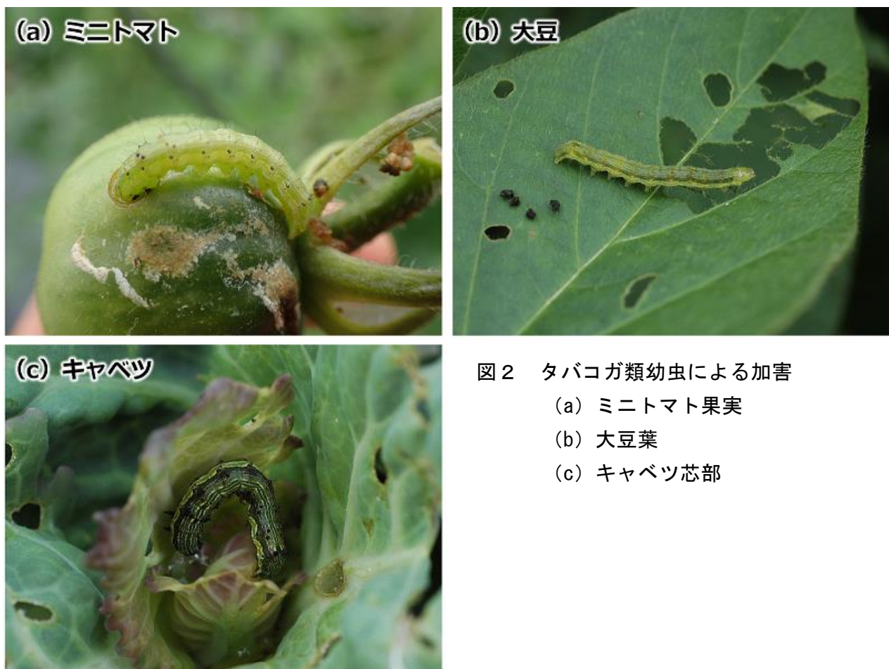
図2 タバコガ類幼虫による加害 (a) ミニトマト果実 (b) 大豆葉 (c) キャベツ芯部

お問い合わせ先：滋賀県病害虫防除所 TEL:0748-46-4926 FAX:0748-46-5559 Email:GC70@pref.shiga.lg.jp http://www.pref.shiga.lg.jp/boujyo