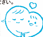
寄り添い型の総合支援