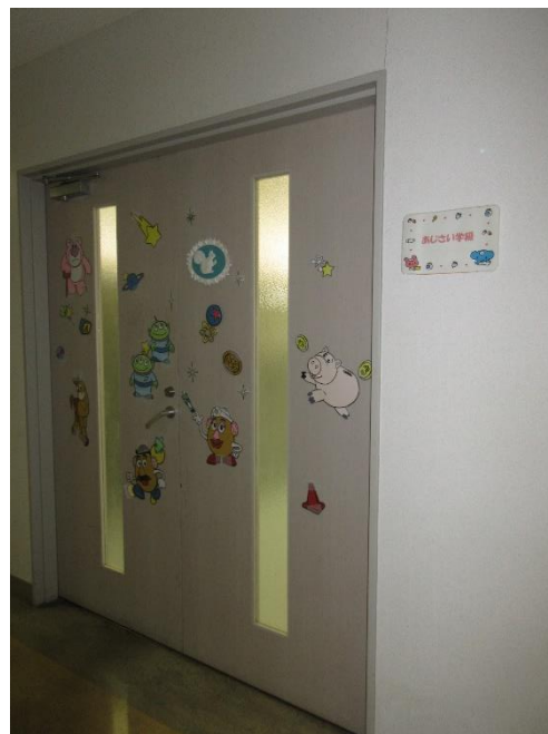
あじさい学級 入口