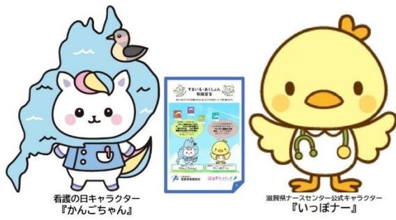
看護の日キャラクター 『かんごちゃん』