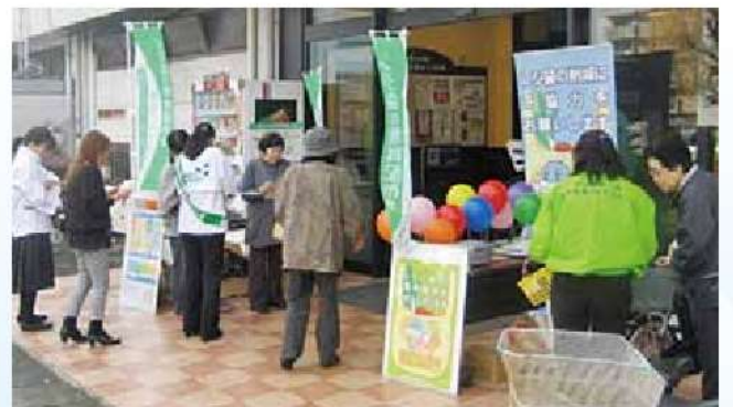
環境に優しい買い物キャンペーン