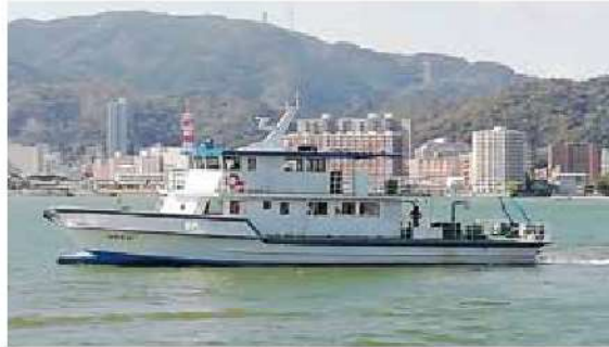
水質調査船「びわかせ」