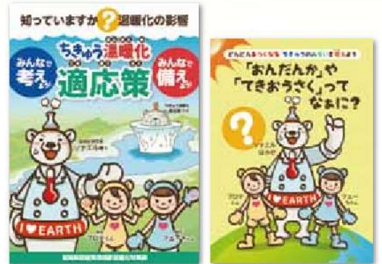
気候変動への適応策を普及するためのパンフレット