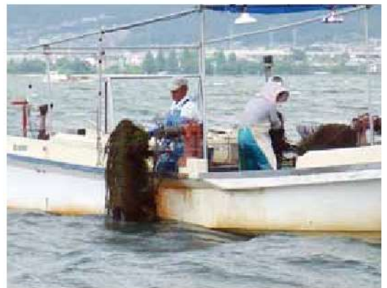
漁船と貝曳き漁具による水草の根こそぎ除去