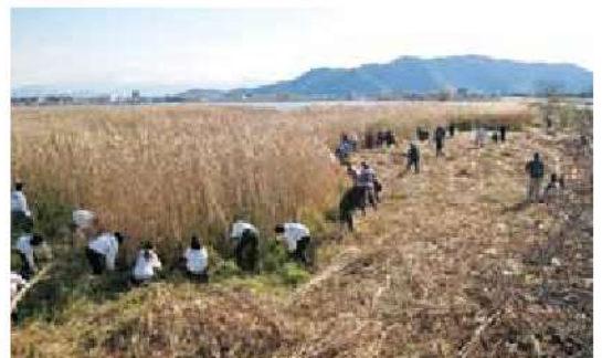
ヨシの刈取り作業