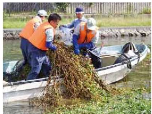
外来水生生物オオバナミズキンバイの除去作業