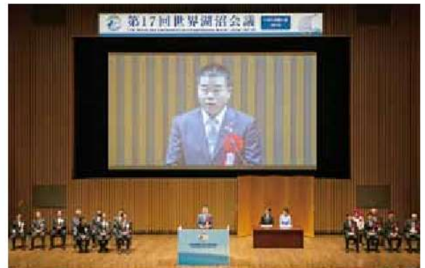
第17回世界湖沼会議（平成30年10月）