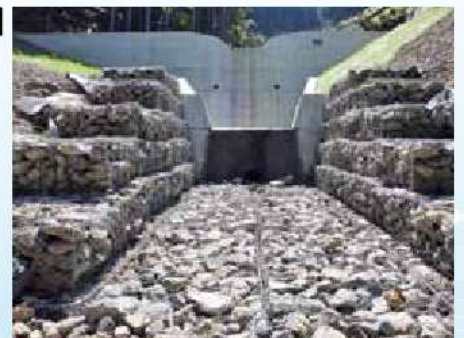
高島市朽木村井における復旧治山事業