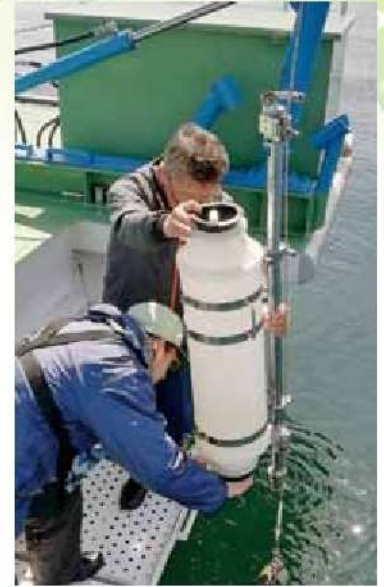
船上での水質調査