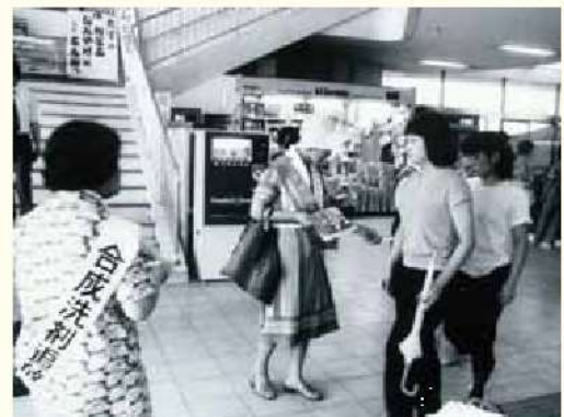
合成洗剤の追放を目指した石けん運動（1970年頃）

このような取組に見られるような、多様な主体の協働、パートナーシップによって経済発展と環境保全を両立させた総合的な取組を、滋賀県では「琵琶湖モデル」と呼んでいます。