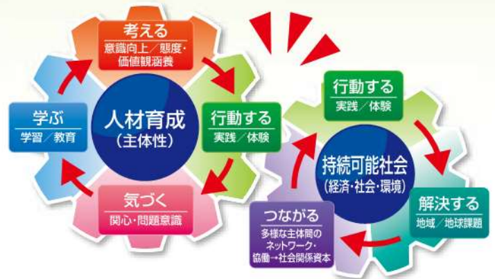
環境学習のギアモデル