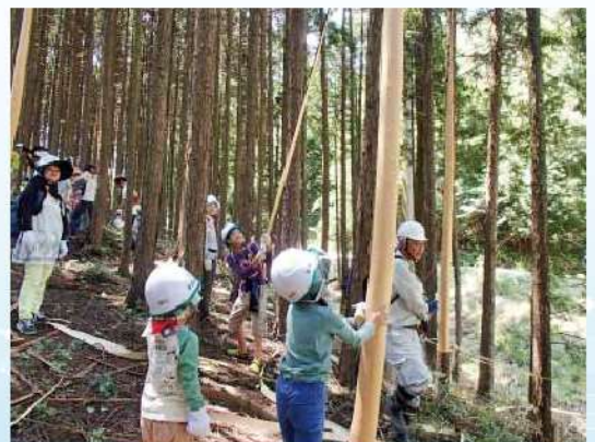
県民の協働による森林づくり