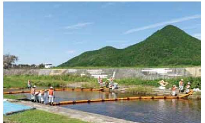
環境団体と行政による水質事故被害拡大防止訓練