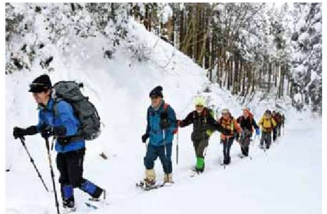
鈴鹿山系の「日本コバ」でのスノーシューハイイク