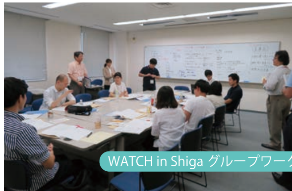
WATCH in Shiga グループワーク