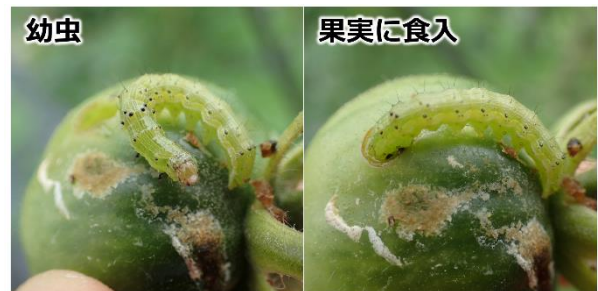
写真 ミニトマトの果実に食入し加害するタバコガ幼虫

お問い合わせ先：滋賀県病害虫防除所 TEL:0748-46-4926 FAX:0748-46-5559 Email:gc70@pref.shiga.lg.jp http://www.pref.shiga.lg.jp/boujyo/