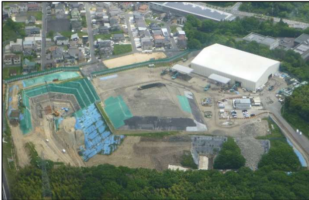
工事中（平成 28 年 5 月）の旧処分場