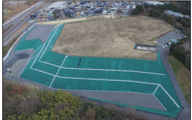
現在（令和 5 年 1 月）の旧処分場