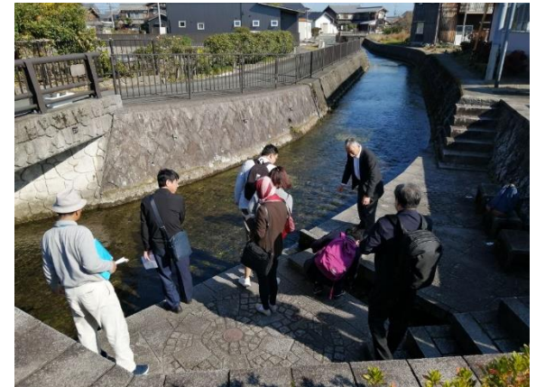
針江生水の郷訪問