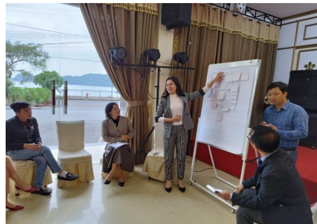
現地研修の様子(令和5年2月)