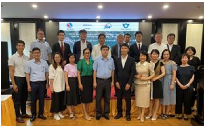
キックオフミーティング(令和4年7月)