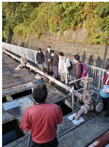
沖島浄化センター訪問