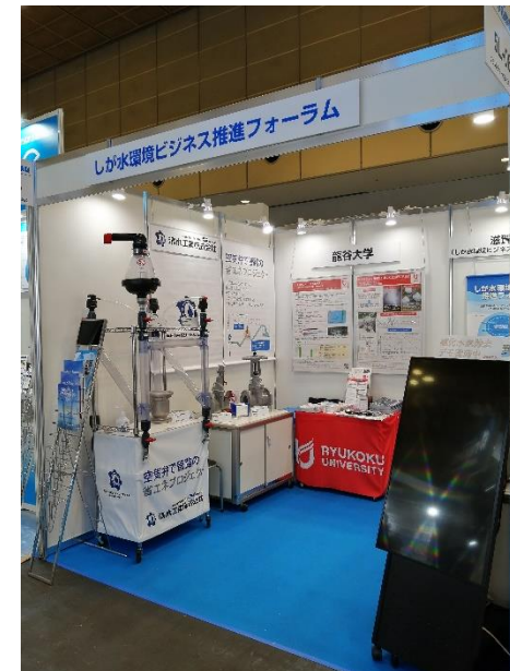
フォーラムブース