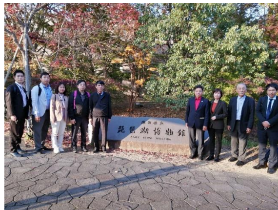
琵琶湖博物館訪問