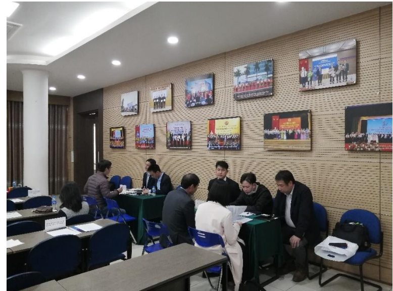
マッチングの様子