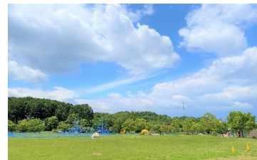
びわこ文化公園（広場）