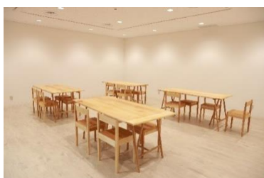
ラボ（多目的スペース）

具体的な時期や内容については、採択後に美術館と調整しますが、まずは応募申請書にどのような連携が可能か企画内容をご記入ください。(連携に要する経費も見込んだ上で申請してください。)