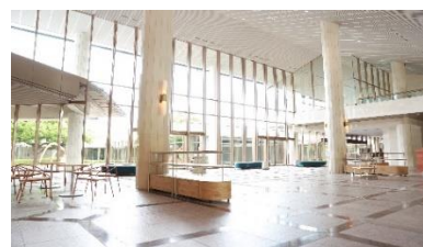
エントランス・ロビー