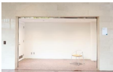
ポップアップ・ギャラリー