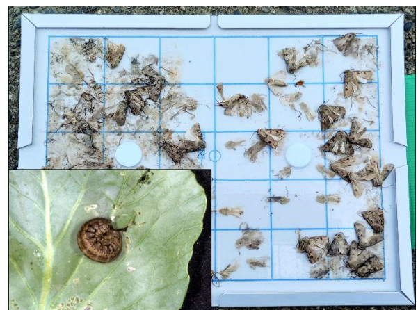
写真 フェロモントラップに誘殺された成虫と老齢幼虫（左下）

お問い合わせ先：滋賀県病害虫防除所 TEL:0748-46-4926 FAX:0748-46-5559 Email:gc70@pref.shiga.lg.jp http://www.pref.shiga.lg.jp/boujyo/