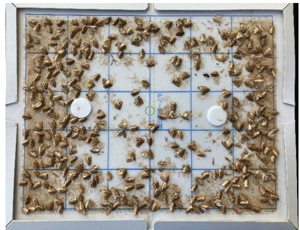
図 フェロモントラップによるチャノコカクモンハマキ成虫誘殺数の推移（甲賀市水口町）