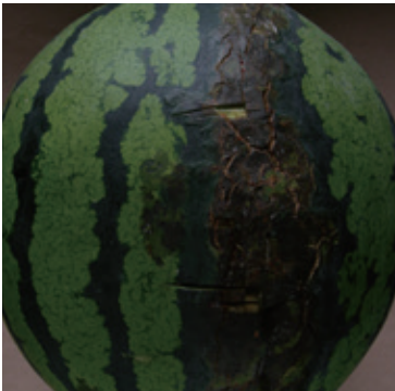
スイカ果実汚斑細菌病