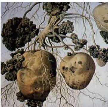
ジャガイモがんしゅ病