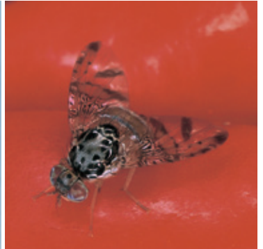
チチュウカイミバエ