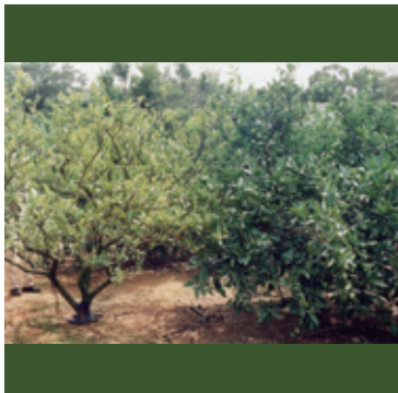
カンキツグリーンング病 (左：感染樹、右：健全樹)