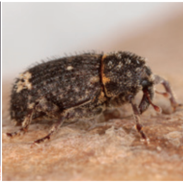
イモゾウムシ成虫