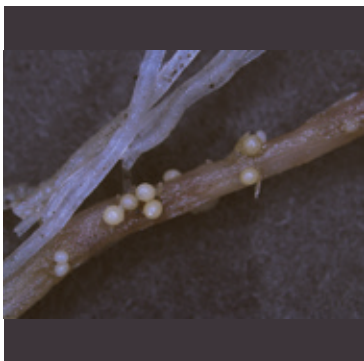
ジャガイモシストセンチュウ (ジャガイモの根に寄生するシスト)