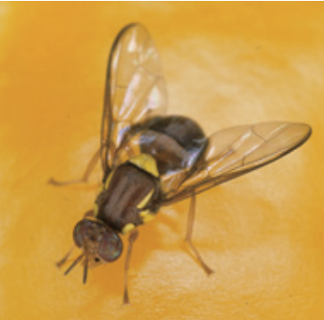
クインスランドミバエ