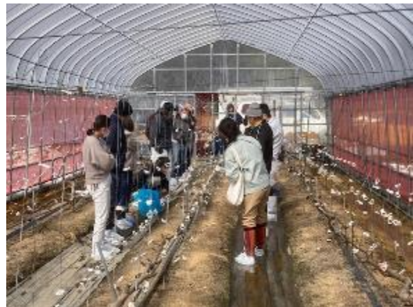
ハウス内での説明