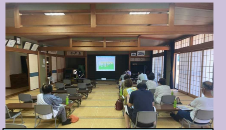
令和4年7月 住民説明会