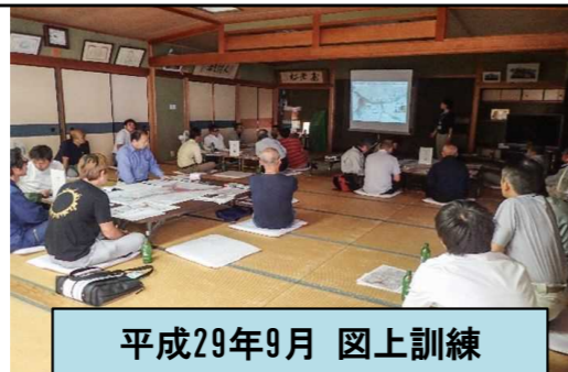
平成29年9月 図上訓練