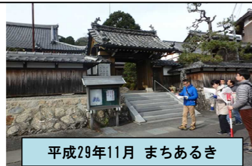
平成29年11月 まちあるき