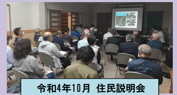
令和4年10月 住民説明会