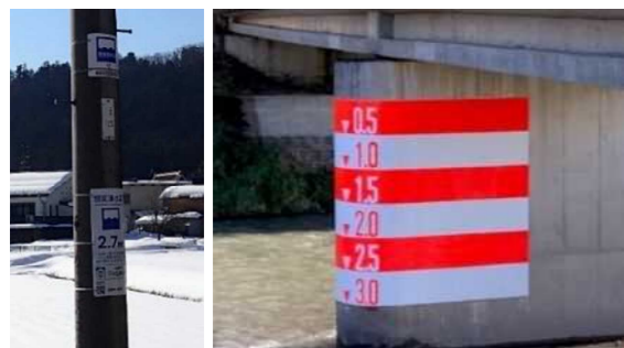
令和2年12月 簡易量水標、まるまち看板設置