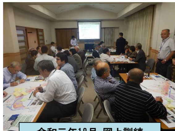
令和元年10月 図上訓練