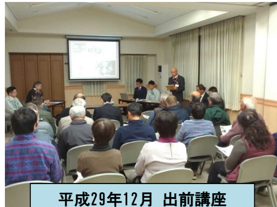
平成29年12月 出前講座