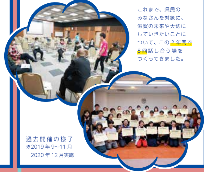
過去開催の様子 ※2019年9~11月 2020年12月実施

未来に向けてみんなで変化しながら、みんなで「幸せ」を感じ続けられる滋賀県にしたい、という思いを込めています。