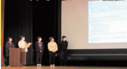
ユースリーダーの発表報告