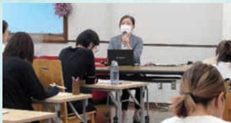
起業支援セミナーの様子

昨年度オープンした「G-NETしが女性の起業応援センター」では、起業やステップアップする際に必要な知識を習得するためのセミナーの開催、コワーキングスペースの運営、チャレンジショップ体験や起業家同士の交流会の開催など、あらゆる角度から伴走型支援を行っています。本年度は、更にパワーアップさせ、セミナーを2クール開催し、定員オーバーでご参加いただけなかった方にも次の開催で受講いただけるようになりました。 コワーキングスペースは、ご利用時間を増やし、夜間もご利用いただけるようになりました。また、専門家の助言を得ながら業務を進められる「オフィスマネージャー在室日」も増えています。ぜひ、センターホームページからご確認ください。