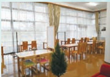
コワーキングスペースの様子