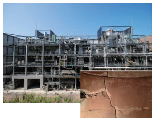
図 3. 東北部浄化センター 焼却炉(耐火煉瓦クラック)