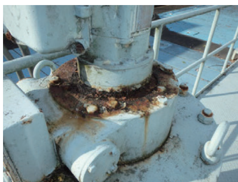
図 2. 湖南中部浄化センター No.1 汚泥掻寄機(腐食)

琵琶湖流域下水道は昭和 57 年より湖南中部で供用を開始し、すでに 40 年を経過した設備もあり、老朽化した設備を、順次改築更新する必要があります。