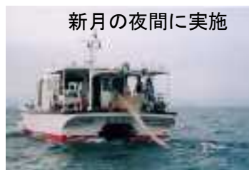
図1 採捕されたアユ仔魚と調査風景(デモ)