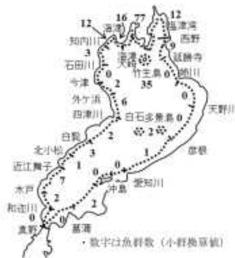
図3 魚群調査結果（2月期）