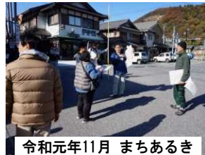
令和元年11月 まちあるき