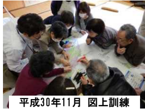
平成30年11月 図上訓練