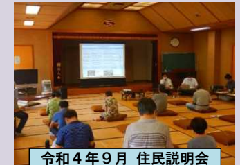
令和4年9月 住民説明会