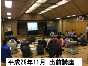
平成29年11月 出前講座