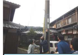
令和元年11月 まちあるき