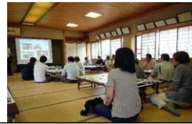
令和元年9月 出前講座、図上訓練