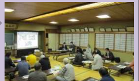
令和3年11月 住民説明会