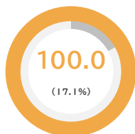
管理職候補者女性比率