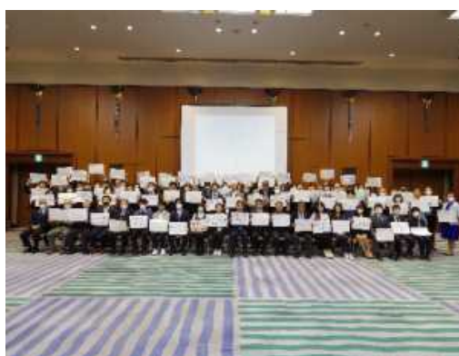
第1回ネットゼロフォーラムしがの様子