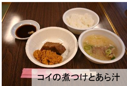
コイの煮つけとあら汁

三方湖は淡水湖とされていますが、海水が入り込んでいるため、魚のくさみが少ないそうです。コイのあら汁は頭まで余すことなくいただきました。すべてとても美味しかったです！