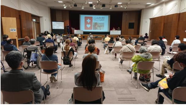
わ音トークショー