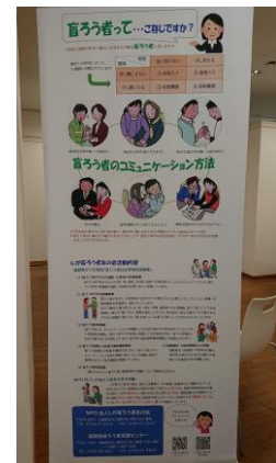
聴覚障害・盲ろうに関する展示