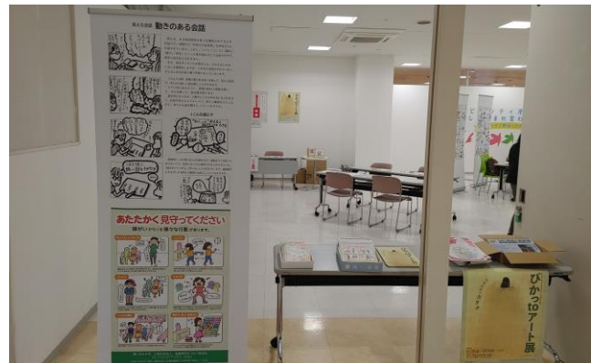
知的障害に関する展示