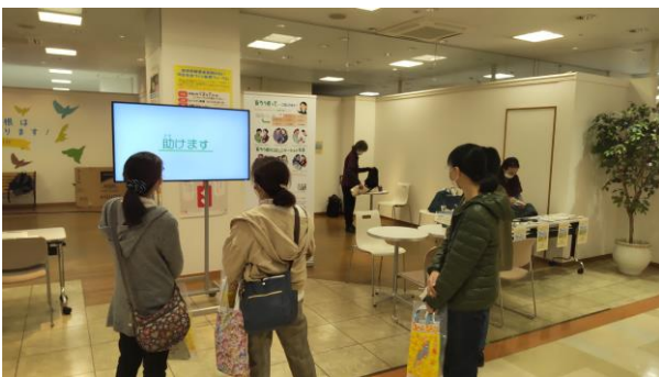
手話啓発動画の放映