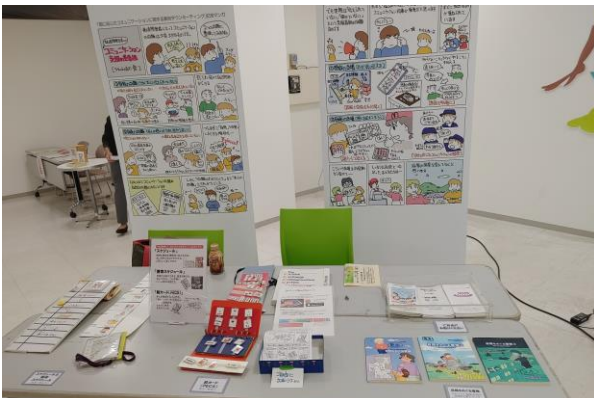
発達障害に関する展示