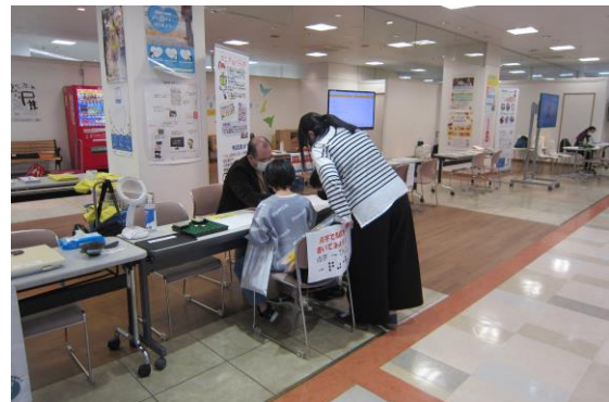
名前を点字で打刻する体験