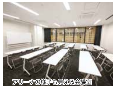
アリーナの様子も見える会議室