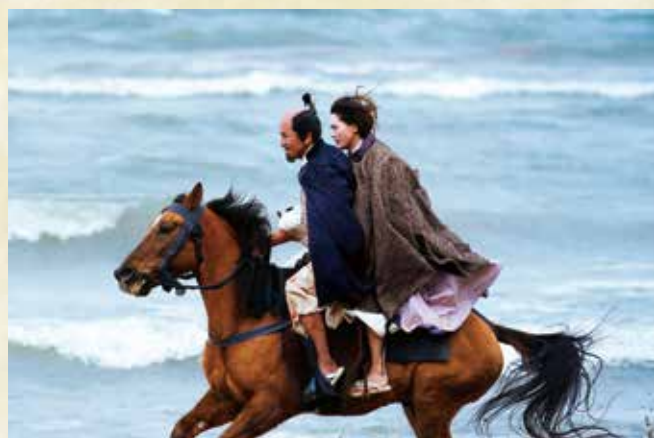
琵琶湖のほつりを駆けるシーン

信長は那古野城、清洲城、岐阜城と移り住んで、最後に造ったのが安土城。その間に家臣がどんどん増えて、家臣の質が変わり、信長と濃姫が背負うものも変わっていった。安土城の築城を現代で例えると、新婚当初1LDKに暮らしていた夫婦が六本木ヒルズを建てるようなものなんです。そうした信長と濃姫の物語にふさわしい城のデザ