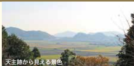
天主跡から見える景色

まっすぐで幅の広い大手道は、戦を想定した造りではなく、天皇を迎えることを念頭に置いた築城と考えられます。