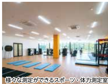
様々な測定ができるスポーツ・体力測定室