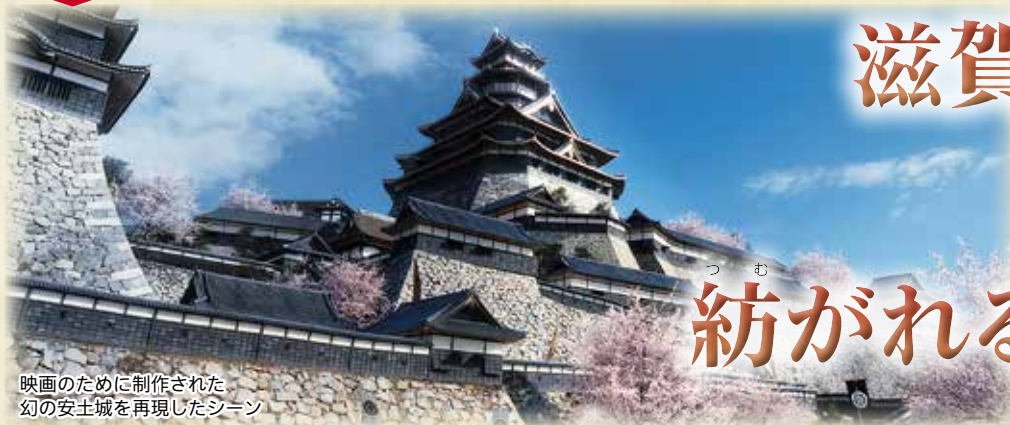
映画のために制作された 幻の安土城を再現したシーン