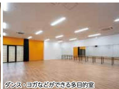
ダンス・ヨガなどができる多目的室