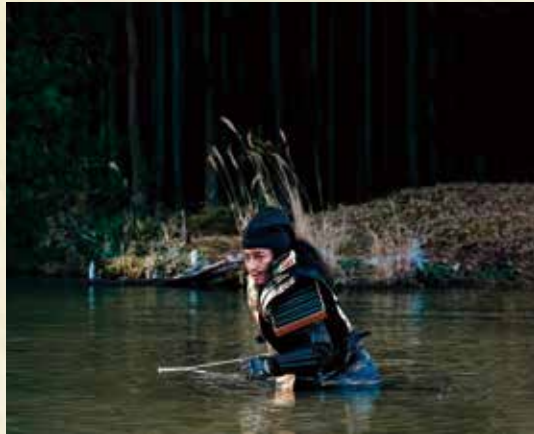
岩尾池(甲賀市)で撮影

今回のロケ地として最も印象的だったのは、夢のシーンを撮った「岩尾池の一本杉」(甲賀市)。岩尾池の水の透明感がすばらしくて底の水苔の緑まで見え、幻想的な空間でした。