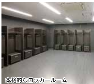
本格的なロッカールーム