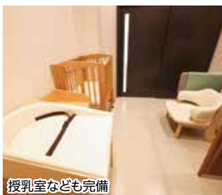
授乳室なども完備