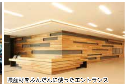
県産材をふんだんに使ったエントランス

県下最大級の体育館内にはアリーナのほか、260メートルのランニングコース、軽食ラウンジ、授乳室やキッズルーム、盲導犬のトイレを完備。トレーニングルームとスポーツ・体力測定室には最新のマシンを設置し、皆さんの健康づくりをサポートします。 体育館の利用者でなくとも利用いただける「森のテラス」は芝生で憩えるスペースがあり、ここで青空ヨガや星空観覧会など開催予定です。地域の方が集う場として、運動しない方もぜひ気軽に利用していただきたいです。