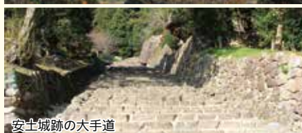
安土城跡の大手道

滋賀には安土城以外にも世界遺産登録を目指す彦根城など、歴史的に重要な城がたくさんあります。公益社団法人びわこビジターズビエローのサイト「滋賀県観光物産情報ウェブサイト」の「近江の城50選」を参考に、城巡りに出かけてみませんか？