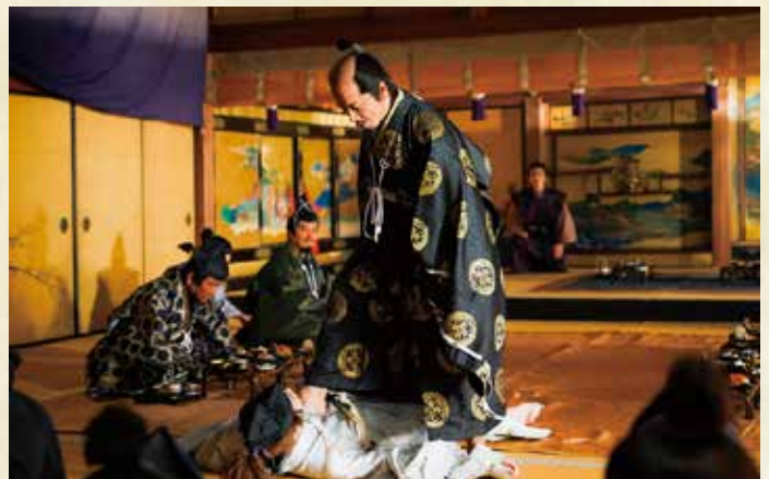
長浜別院大通寺(長浜市)で撮影

光秀が家康を饗応するシーンを撮影した長浜の大通寺もよかったです！床の間やふすま絵などの設えから醸し出される格式の高さを感じて、セットをやめて大通寺で撮ろうと決めました。