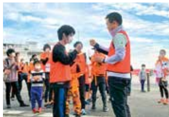
第13回びわ湖一周オレンジリボ なすきリレー出発式に出席!

県広報誌「滋賀プラスワン」は、点字版・音声版でも配布しています。音声版の「みんなでプラスワン!」のコーナーは三日月知事の朗読によりお聞きいただけます。