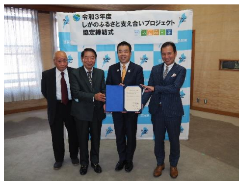
協定締結の様子 (R3東草野×フラットフィールド)