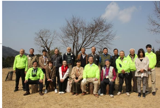
リーダー人材育成研修最終会 (R3走井会場)