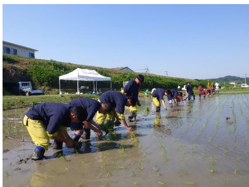
高校との連携 (R3甲賀市牛飼)