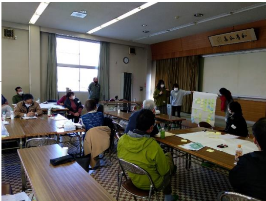
事業計画づくりワーク ショップ (R3沖島会場)