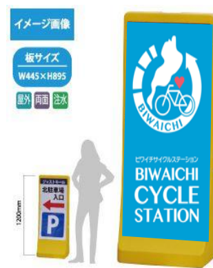
10 注水式スタンド看板(大)