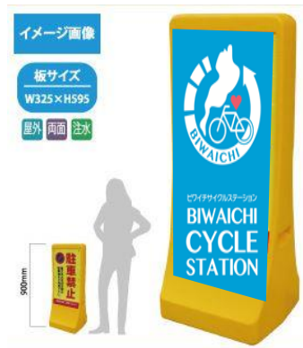
9 注水式スタンド看板(小)